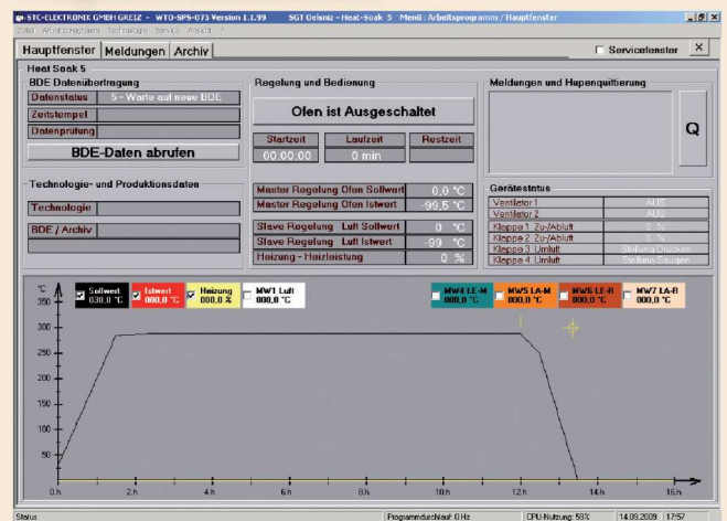
Heat Soak Test